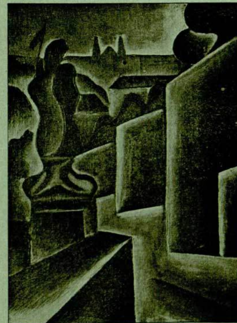
Karel Teige — Praha

Zašto mi tako retko vidamo dobar i umetnički film?