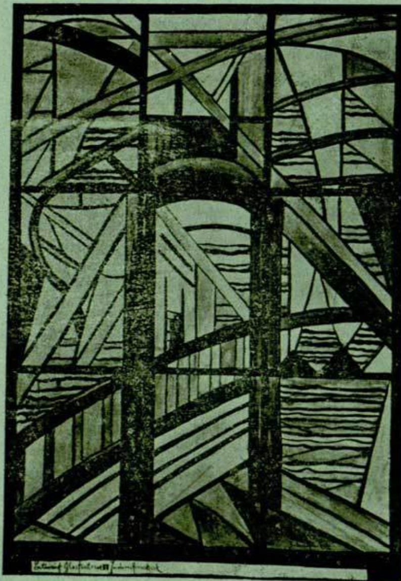
Jacoba van Heemskerck — Domburg Stakleni prozor, No. 17

Praska snažno nebo psalam IKS utopiji i tko će korigovati napadaj na sotonu. Tko?