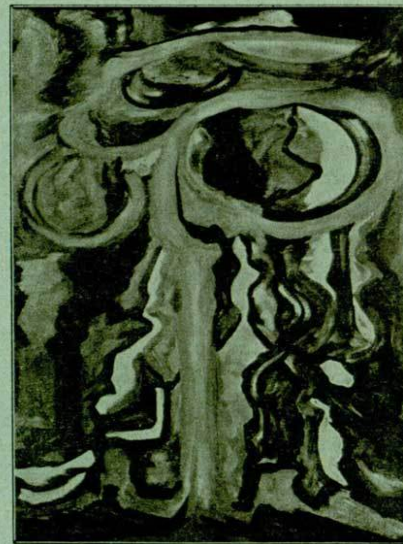
Jacoba van Heemskerck — Domburg Slika No. 107

ne gubeći svoju čvrstinu linije. Ova ne samo da nije smanjena nego se u ostalom otkriva jedno hrabrije ubedenje u svatanju. I od tada jedna druga tehnika spaja se sa prethodnom: broj drvoreza povećava se brzo svedočeći snagu izraza koja se ne može postići u crnom i belom. Posle slikani prozori, vitrine, izgledaju da privlače sa velikim uspehom njenu pažnju. Mi ne bi trebali da se čudimo imajući u vidu horizonte koje oni otvaraju u upotrebu uzvišenih harmonija i divnih kontrasta boja koje moraju iskušati jednu umetnicu temperamenta Heemskerckove. Ono što frapira studirajući njena dela, to je način s kojim ona razume granice svake tehnike kojom se služi. Ne može se dovoljno nadići različenosti izraza u njenim slikama, akvarelima, drvorezima i rad na staklu; ovi poslednji budući su rađeni klasičnom strogošću, sjedinjujući se sa stilom monumeta za koji su i rađeni; drvorezi pokazujući kao dominantni karakter ravnotežu, ritam, koji zajedno daju impresiju dubine čak uzvišenosti, dok u slikama inspiriranim idejom, izgleda da si dozvoljava jedan slobodniji elan, odakle opet proizlazi jedna savršena radost života ili borbe protiv zla ili himna bogovima. Ipak monumentalni karakter, tako specialan u ovim delima nigde ne slabi. Svuda se pokazuje ono duboko poštovanje uzvišenosti koje nas odnosi prema duhovnim visinama, koje se otvaraju pred našim duhom.