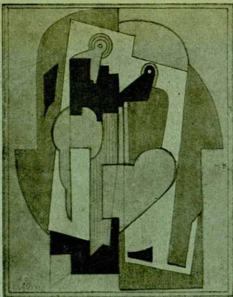
Albert Gleizes — Paris